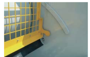
Système de sécurité vis.