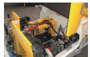
Interieur accessible, facile entretien.