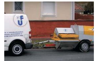
Système de remorque.