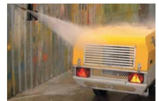
Laveur haute pression hydraulique.