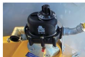
Ref. 46243 Kit compteur d'eau.