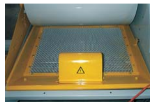
Tamis vibrant mortier complet.