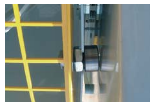
Système sécurité malaxeur.