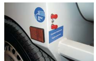
Plusieurs points de graissage distribué par toute la machine.