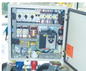
Tableau électrique. Nome européenne 73/23 EU