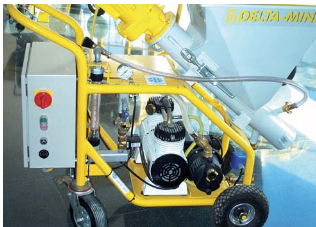
Robuste châssis tubulaire.

Exigez toujours les pièces de rechange et outils originaux. Le développement continu de nos produits fait qu'ils sont à sujets des changements ou modifications techniques sans avis préalable.