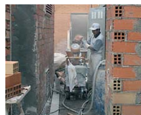
Pratique en espaces réduits