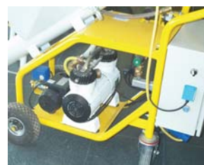
Compresseur d'air 170l/min