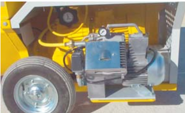
réf. 46160 Kit projection Vario.