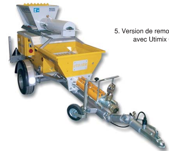
5. Version de remorque avec Utimix C40.