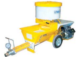
2. Option avec malaxeur horizontal.