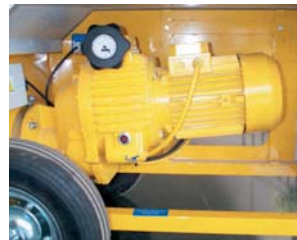
3. Version avec variateur.