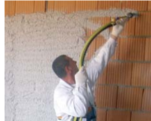
1. Option: Kit de projection.

Exigez toujours des pièces de rechange et outils originaux. Le développement continu de nos produits fait qu'ils sont sujets à des changements et modifications techniques sans avis préalable.