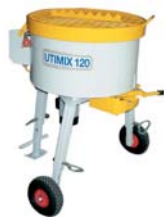
réf. 0198085 120-380 V. réf. 0198086 120-230 V Malaxeur horizontal 120 l.