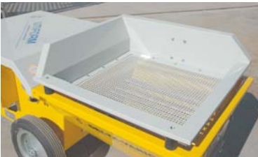
réf. 46115 Vibreux vario complet.