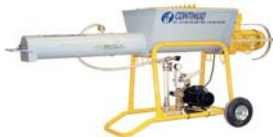
réf. 0198040 Malaxeur continu C40.