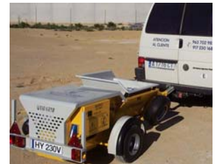
4. Version avec remorque.